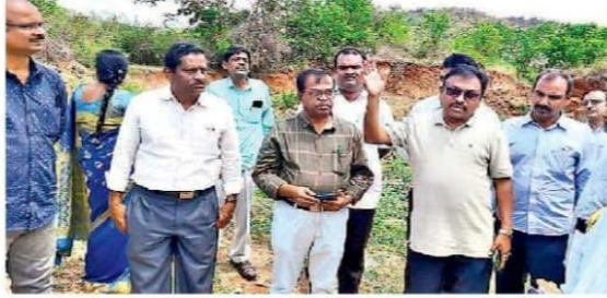
కళాశాల స్థలాన్ని పరిశీలిస్తున్న రాష్ట్ర కళాశాల విద్యా కమిషనర్, ఆర్డీ తదితరులు